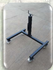
Cavalletto di sostegno regolabile in altezza