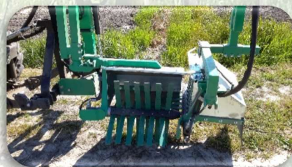
Testa spollonatrice con fustelle