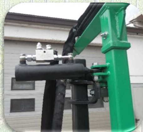
Cilindro per il rientro del braccio scavallante