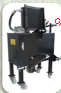
Impianto Idraulico 50 LT Portata 40 LT/MIN