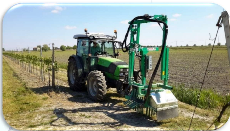
Spollonatrice SPS-650 in posizione di trasporto