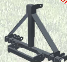
Attacco per sollevatore a 3 punti