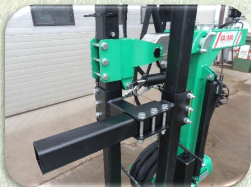
Regolazione profondità della testata spollonatrice interna