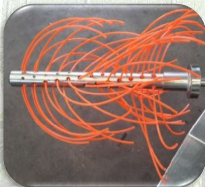
Rullo a fili per diserbo meccanico