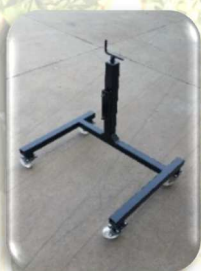
Cavalletto di sostegno regolabile in altezza