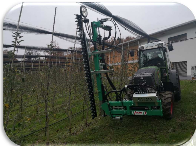
CKP2BV. Cimatrice a 2 piani di taglio verticale( 2 + 1 Mt.)