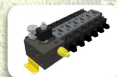
Distributore 5/7 movimenti