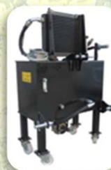
Impianto idraulico per trattori reversibili Pompa 26L.