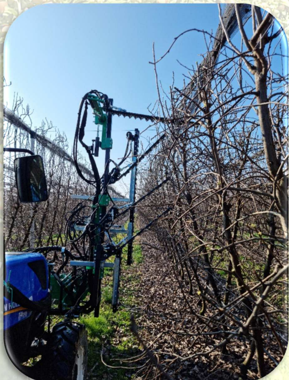
CKP con più piani di taglio orizzontali