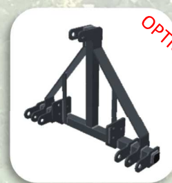
Attacco sollevatore 3 punti