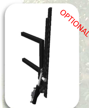
Porta barre verticali girevole