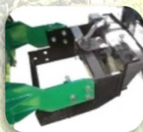
Flangia universale con 2 posizioni d'attacco