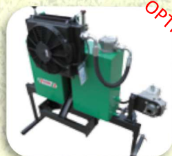
Impianto Idraulico Pompa 26L.