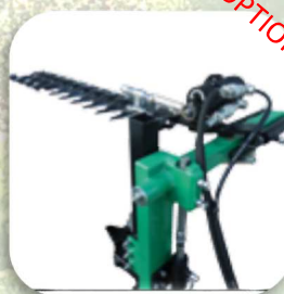
Barra orizzontale superiore con rientro e inclinazione idraulica