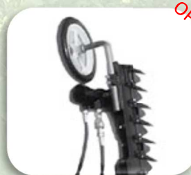
Ruotino salva reti