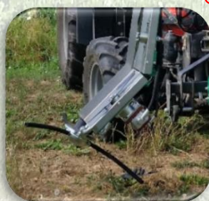
Coltello sylvoz con motore idraulico Inc.(45°)