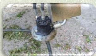
Convogliatore di tralci