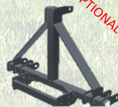
Attacco per sollevatore a 3 punti