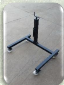
Cavalletto di sostegno regolabile in altezza