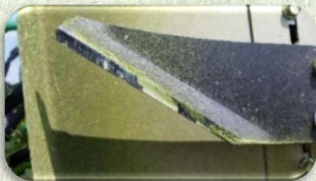
Coltelli autopulenti in acciaio speciale anti incrostamento