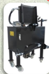
Impianto Idraulico 50 LT Portata 40 LT/MIN