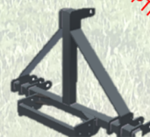
Attacco per sollevatore a 3 punti