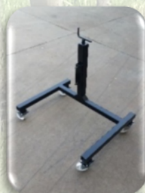
Cavalletto di sostegno regolabile in altezza