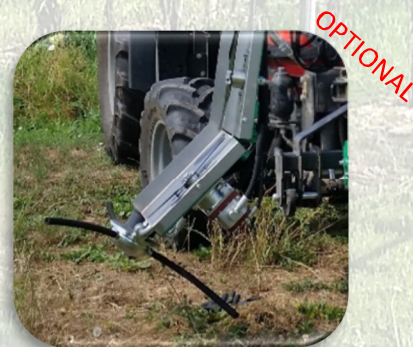
Coltello sylvoz con motore idraulico Inc.(45°)