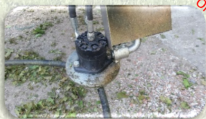
Convogliatore di tralci