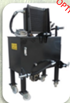
Impianto Idraulico 50 LT con pompa 20cc