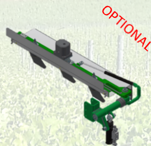
Barra Topping Inclinazione Idraulica