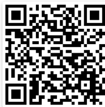
Scannerizza per video

Rivenditore - Dealers - Revendeur - Händler