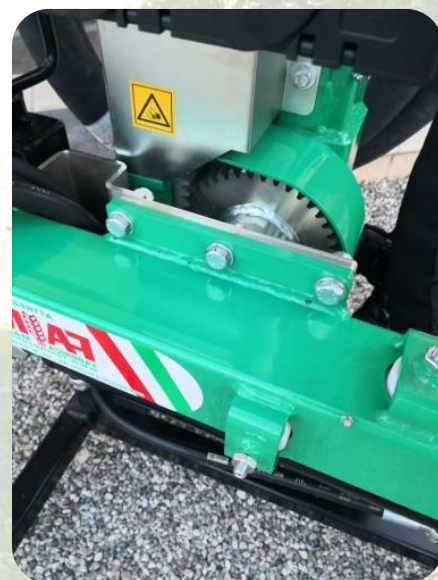
Regolazione angolo di lavoro da 40 Cm a 70 Cm