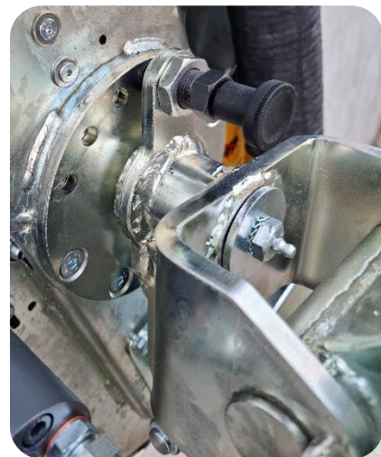
Rotazione testata 240°