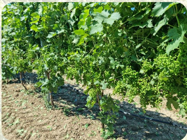
Pulizia senza danneggiare il grappolo