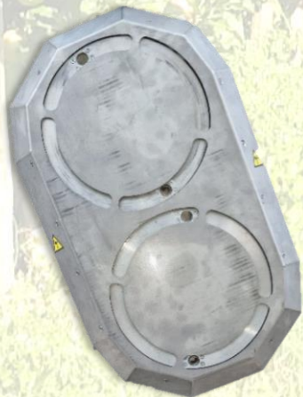
Tecnologia a ugelli brevettata