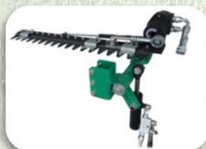
Barra Topping Inclinazione Idraulica