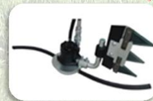
Convogliatore di tralci