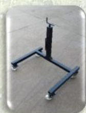
Cavalletto di sostegno regolabile in altezza