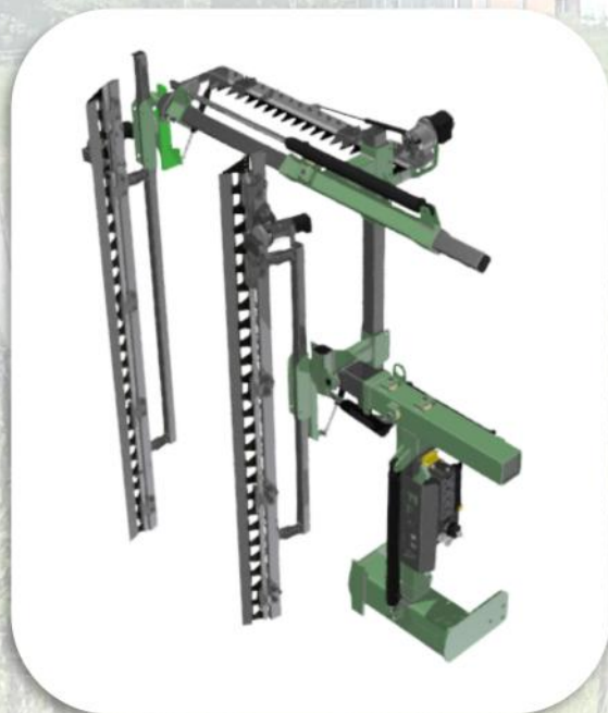
CL 200 Scavallata

Si consiglia una presa di ritorno libero.