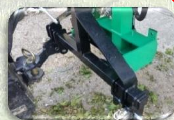
Attacco sollevatore 3