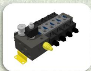
5 o 7 Movimenti